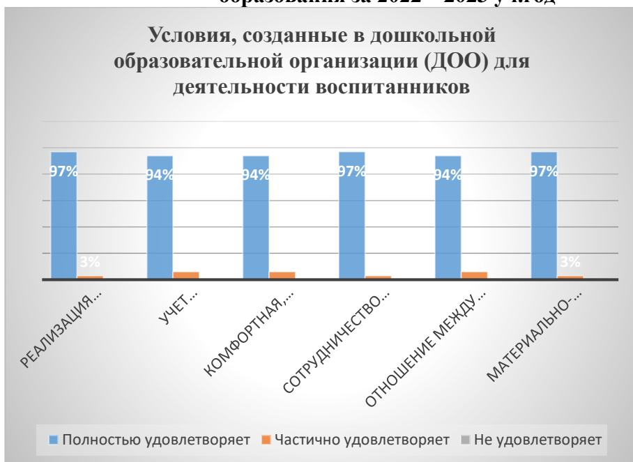
Диаграмма оценки уровня удовлетворенности родителей услугами дошкольного образования за 2022 – 2023 уч.год

В конце учебного года проводилось анкетирование родителей «Оценка удовлетворенности родителей деятельностью дошкольного учреждения». В анкетировании по оценке уровня удовлетворенности родителей деятельностью дошкольного учреждения участвовало 33 семьи, что составляет 85 % от возможного числа респондентов. Анкетирование показало, что родители готовы на взаимодействие и сотрудничество, не остаются равнодушными к жизнедеятельности ДОО.